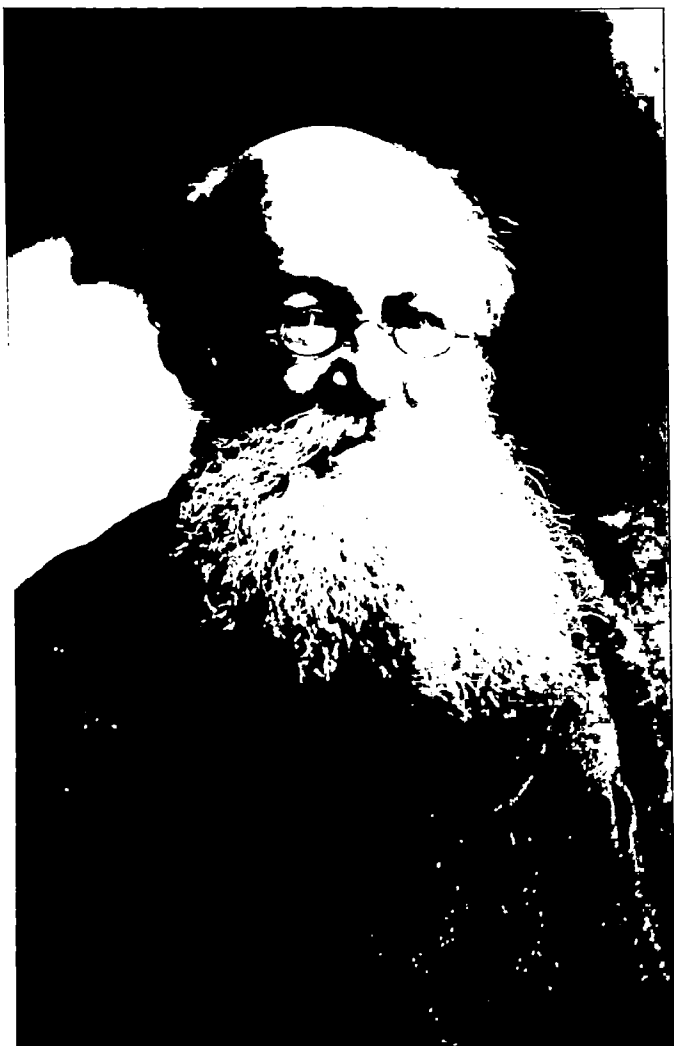
PIOTR ALEKSÉYEVICH KROPOTKIN (1842-1921)